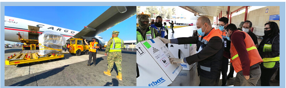
Las dosis de las vacunas COVID-19 fueron recibidas en el Aeropuerto Internacional Benito Juárez de la Ciudad de México.

Con el total actual de 53.625 dosis de vacunas recibidas por el Gobierno de México, y con otras previstas para los próximos días, el Centro Nacional de Salud de la Niñez y la Adolescencia (CENSIA) destacó que las vacunas necesarias adquiridas podrán cubrir la vacunación del resto de la población mexicana. Sin embargo, el Secretario de Salud, Jorge Alcocer Varela, recordó a todos que deben seguir observando las medidas de precaución ya que la lucha contra COVID-19 no ha terminado todavía. Leer más