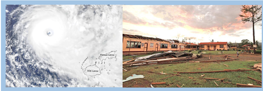
Imagen satelital de TC Yasa dirigiéndose a la isla de Fiji. (Izquierda). Escuela dañada en Daku, Vanua Levu. (Derecha)