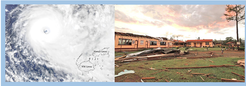
Image satellite du CT Yasa se dirigeant vers l'île de Fidji.. École endommagée à Daku, Vanua Levu