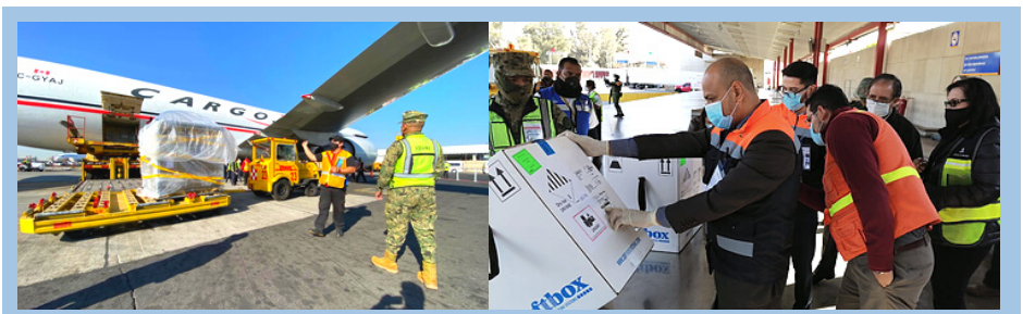
Les doses de vaccins contre la COVID-19 ont été reçues à l'aéroport international Benito Juárez de Mexico.

Avec un total actuel de 61 425 doses de vaccins reçues par le gouvernement mexicain, et d'autres attendues dans les jours qui suivent, le Centre National pour la Santé des Enfants et des Adolescents (CENSA) a souligné que la quantité de vaccins achetée pourra assurer la vaccination du reste de la population mexicaine. Toutefois, le secrétaire d'État à la Santé, Jorge Alcocer Varela, a demandé à tous de continuer à observer les mesures de précaution, car la lutte contre la COVID-19 n'est pas encore terminée. Lire la suite.